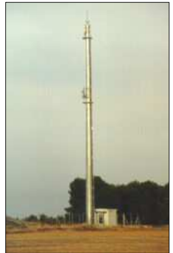
Antena instalada en el campo

En este aspecto, la comunidad de vecinos que va a firmar un contrato de arrendamiento de su azotea para la instalación de una antena base de telefonía móvil debe tener muy claros los siguientes puntos: